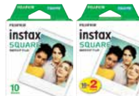
1 盒，每盒 10 张 2 盒，每盒 10 张