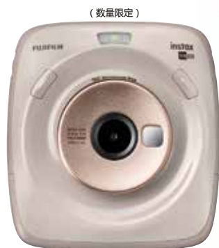
米色 JAN 4547410351156