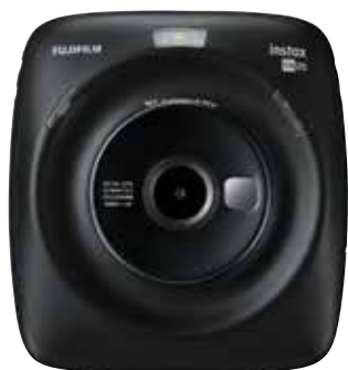
黑色 JAN 4547410351156