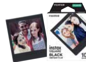
1 盒，每盒 10 张