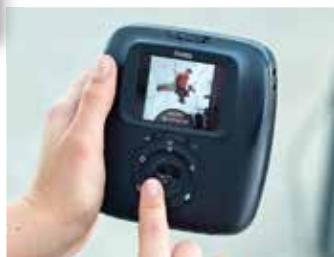
打印精彩瞬间非常简单 - 只需转动后面的拨盘即可！